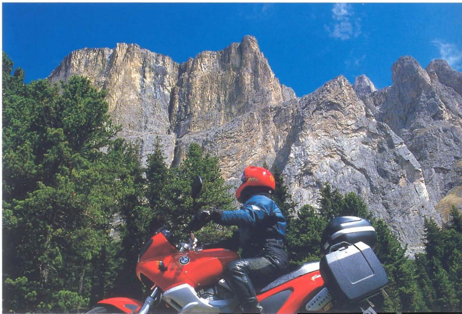
Das typische Dolomiten-Motiv: Der Blick auf die Blöcke der Sella-Gruppe.

Der Einstieg in die Sellajochstraße liegt in dem Städtchen Canazei (1.465 Meter). Die breite und bestens ausgebaute Fahrbahn steigt zunächst in einer weiten Schleife und dann in mehreren engen Kehren nach Norden an. Immer wieder blitzen zwischen den dichten Bäumen die Dächer von Canazei durch.