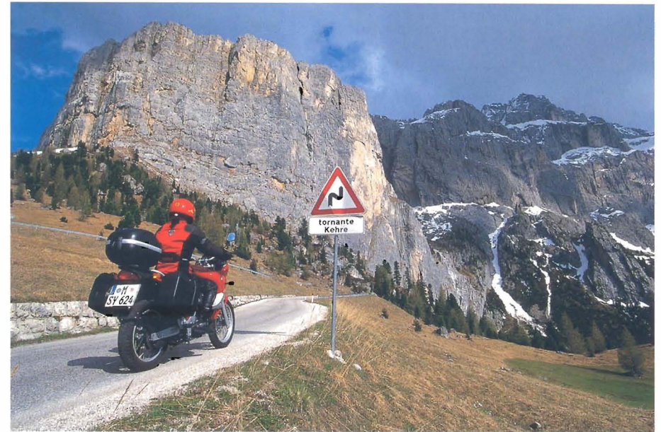
Kurventanz mit Anspruch: Die Überquerung des Grödner Jochs.

Wir reduzieren daher das Tempo. So kann man sich hin und wieder einen gefahrlosen Blick auf die mächtigen Türme der Sella-Gruppe (3.151 Meter) sowie auf den Langkofel (3.181 Meter) leisten.